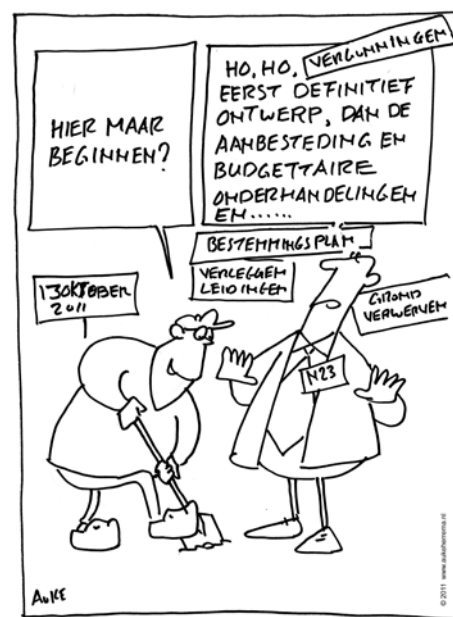
START N23 (WESTFRISIAWEG)