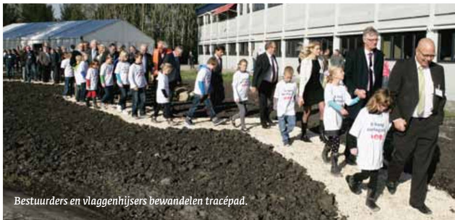
Bestuurders en vlaggenhijzers bewandelen tracépad.

Voor het officiële startsein waren 16 jonge vertegenwoordigers van de N23-partners en tevens toekomstige weggebruikers uitgenodigd om samen met de verantwoordelijke bestuurders de vlaggen uit te rollen. Met als uitgangspunt 'Samenwerking hoog in het vaandel' hoopt de provincie één van haar grotere infrastructurele projecten – de aanleg en opwaardering van de N23 Westfrisiaweg – te realiseren.