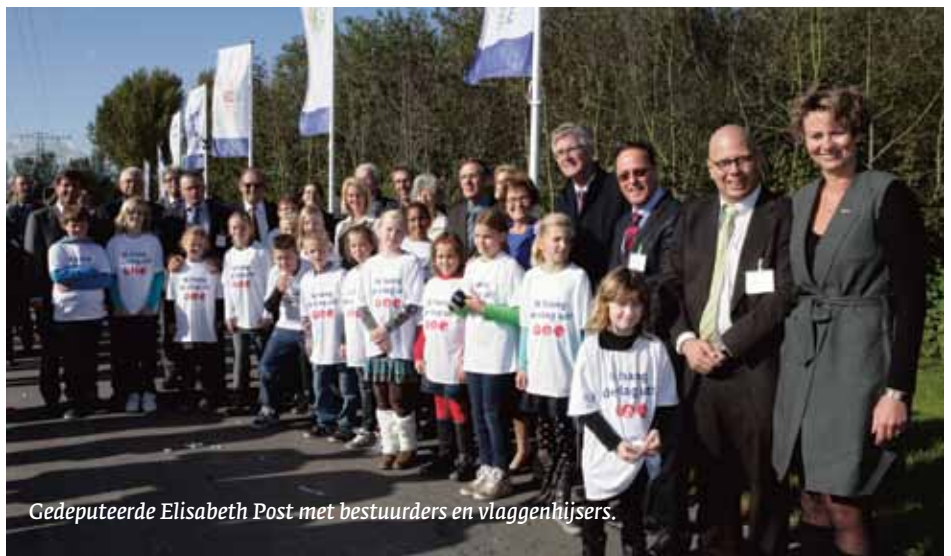
Gedeputeerde Elisabeth Post met bestuurders en vlaggenhijzers.

In het bijzijn van 150 genodigden gaf gedeputeerde van de provincie Noord-Holland Elisabeth Post op donderdag 13 oktober 2011 het startsein voor de voorbereiding van de realisatie van de N23 Westfrisiaweg. Op het terrein van het nieuwe projectbureau in Zwaag (gemeente Hoorn) wapperen sinds die dag naast de vlag van de provincie Noord-Holland en de N23 Westfrisiaweg ook de vlaggen van de samenwerkingspartners als symbool voor intensieve samenwerking en overeenstemming.