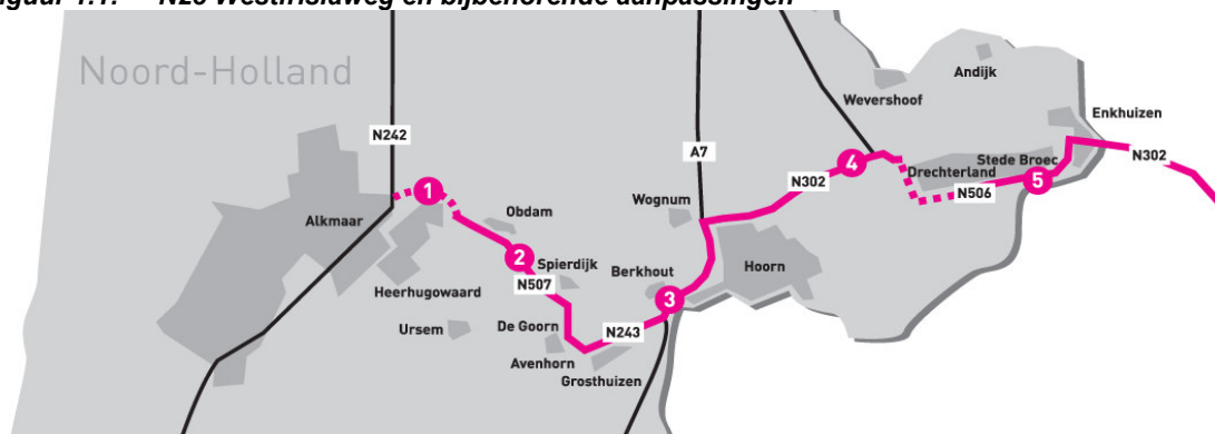
Figuur 1.1: N23 Westfriisiaweg en bijbehorende aanpassingen

Al meer dan 40 jaar wordt gesproken over het opwaarderen van deze weg. De Westfriisiaweg is het Noord-Hollandse deel van de gewenste verkeersverbinding N23 van Alkmaar naar Zwolle. Met de opwaardering verbetert niet alleen de bereikbaarheid van de regio maar is ook van belang voor de economische structuur en de werkgelegenheid. Ten behoeve van de ontwikkeling van het plan 'N23 Westfriisiaweg' is Grontmij bezig met het uitvoeren van een aantal onderzoeken in het kader van het inpassingsplan. Onderdeel van het inpassingsplan is het externe veiligheidsonderzoek.